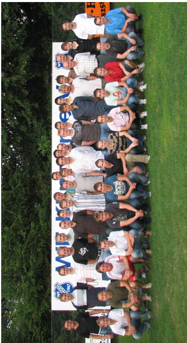
Kreisliga Kader der Wanderfreunde Klingen Saison 2006/2007