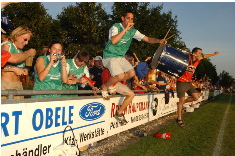
Der Schlusspfiff in Pöttmes, beim Entscheidenden Relegationsspiel gegen Feldheim