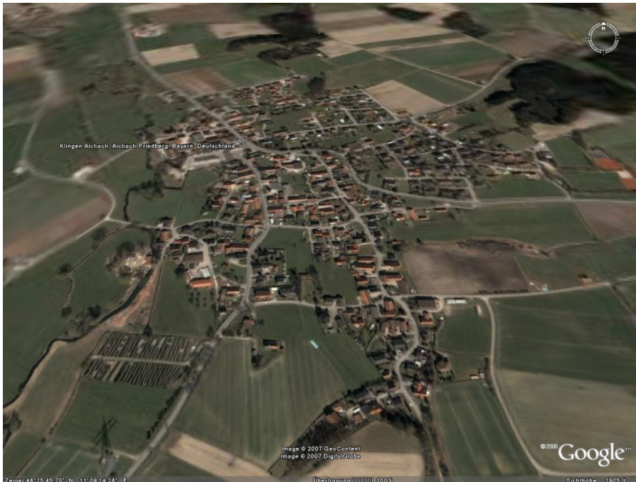
Klingen von oben

Das Interesse an unseren Veranstaltungen war groß: 2300 Voranmeldungen zu unserem Herbstmarsch gingen ein. Um für den Veranstaltungstag gut gerüstet zu sein, die Veranstaltung erfolgreich über die Bühne bringen zu können und um für ein geschlossenes Auftreten zu sorgen, gründete man acht Tage vor der großen Veranstaltung am 15. Oktober 1967 den Verein der Wanderfreunde Klingen mit Sitz in Klingen. Gründungsort war das Gasthaus Büchel, in dem eine erste Satzung erstellt und angenommen und die erste Vorstandschaft gewählt wurde.