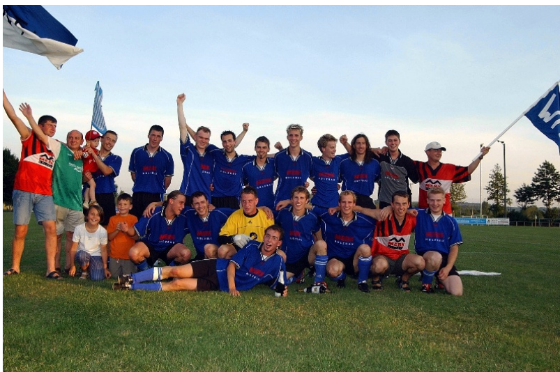
Aufstieg in die Kreisliga – Ost am 11.06.2003